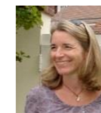
Véronique Motel Hôpital Necker