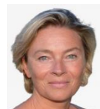
Florence Delaval Hôpital Mignot, Clinique des Pages, Bullion et suivis à domicile (78)