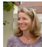
Véronique Motel Hôpital Necker